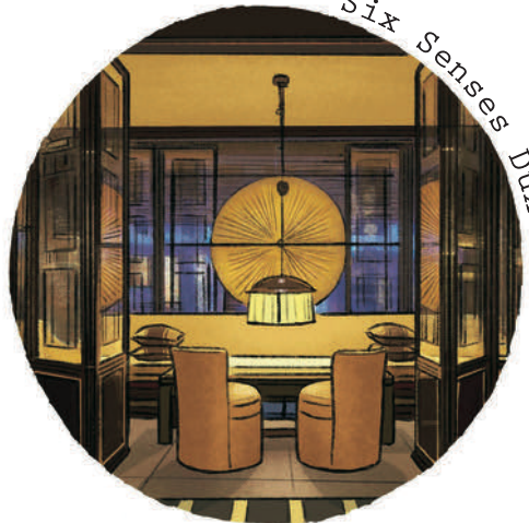
Six Senses Duxton

Wer Singapur besucht, bekommt eine Ahnung davon, wo das alles mit der Welt noch hinführen wird. Da stapeln sich Wohnungen bis in den Himmel, da wachsen Häuser, die nicht mehr wie welche aussehen, da blinkt die Möglichkeit aus allen Richtungen. Auf den Dächern der Rooftop Bars sitzen Menschen, die ihre Sonnenbrillen nie abnehmen, und Badende drängeln sich in Pools, dabei in jeder Hand mindestens ein Handy. Wer nicht geschäftig wirkt, fällt gleich auf. Genauso wie ein Gebäude, das älter und kleiner ist, und auf das das Auge Bezug nehmen kann, weil es vertraut ist: drei Stockwerke, ein Dach. Am Rande von Singapurs Chinatown, etwas abseits vom Architektur-Höher-Schneller-Weiter des Stadtstaates in Südostasien, steht dieses Haus von 1860, in dem einst mit Muskatnüssen gehandelt wurde. Dunkel und fest verankert liegt es in einer zumindest am Tag ruhigeren Straße. Einst wurden in dieser Straße nicht nur Gewürze vertrieben, auch für Opium und Glücksspiel war sie bekannt. Auch wenn in den Seitenstraßen des Bezirks Tanjong Pagar heute noch chinesische Arznei angeboten wird, in diesem Gebäude werden seit ein paar Monaten nur noch Gäste des „Six Senses Duxton“ bewirtet. Über 40 Zimmer und Suiten in